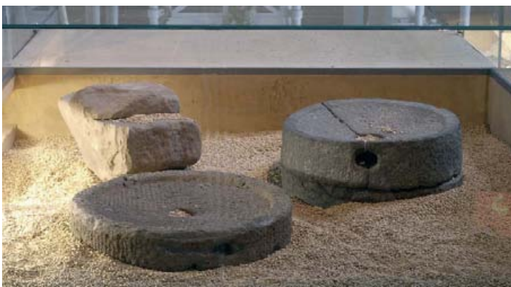
Abb. 13: Mahlstein und Drehmühlen aus eisenzeitlichen Siedlungsplätzen. Mahlsteine wie der aus Petershagen (Kr. Minden-Lübbecke, oben links) wurden aus örtlichem Steinmaterial hergestellt. Die Drehmühlen aus Basaltlava von Sendenhorst (vorn links) und Beckum (rechts) (Kr. Warendorf) hat man hingegen von Spezialwerkstätten bei Mayen in der Eifel bezogen. Solche Funde belegen die logistische Reife des Handels in der vorrömischen Eisenzeit.

Bekanntlich hat man in der Eisenzeit Höhensiedlungen befestigt – meist nur