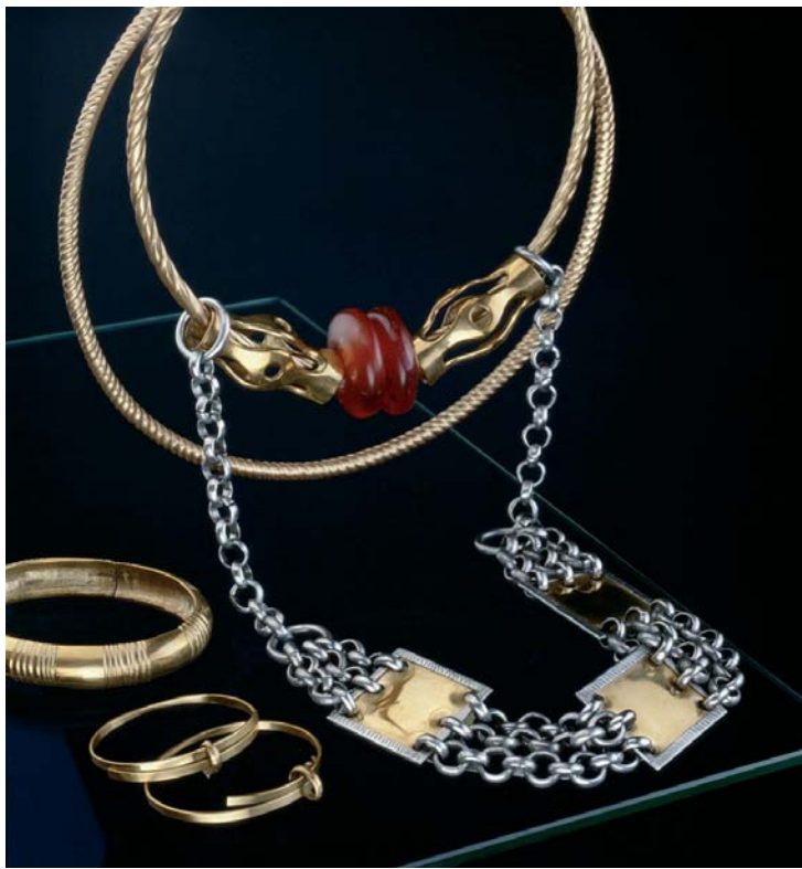
Abb. 19: Schmuckgarnitur eines eisenzeitlichen Menschen aus der Zeit um 500 v. Chr., die 1995 in Warendorf-Milte (Kr. Warendorf) entdeckte wurde. Materialechte Rekonstruktion in Bronze, Bernstein und Eisen (Landesmuseum Herne).

Was bezweckte die wohlhabende Frau von Lienen-Kattenvenne (Kr. Steinfurt), als sie im 6. Jahrhundert v. Chr. ihren reichhaltigen Halsschmuck in einem moorigen Dünengelände versenkte (WILHELMI 1979)? Ihren Besitz über eine unruhige Zeit hinweg zu retten oder eine Naturgottheit im Hinblick auf Familienleben und Glück gewogen zu stimmen? Die bronzenen Halsringe mit den großen Bernsteinperlen hat sie jedenfalls zum Glück nicht wieder abgeholt. Denn sonst hätten wir kaum erfahren, dass der Bernstein, der an der Nord- und Ostseeküste gewonnen und bis zum Mittelmeer gebracht wurde, unterwegs auch in Westfalen Abnehmer fand. Denn Bernstein fehlt unter den Grabfunden: die Perlen haben die Hitze der üblichen Leichenverbrennung nicht überstanden.