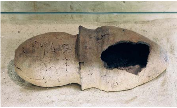
Abb. 3: Ostbevern-Schirl (Kr. Warendorf). Sarg eines Kleinkindes, aus zwei Haushaltsgefäßen gebildet. Frühbronzezeit.