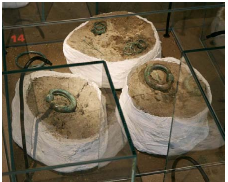
Abb. 18: Ausnahmen in der Eisenzeit Westfalens: Reste der unverbrannten Leichen eingewanderten keltischen Frauen in Peterhagen-Ilse (Kr. Minden-Lübbecke). Hier: Grabausstattung von „Ophelia“ (Grab 14), Bronze und Bergungsblöcke.

Unter den eisenzeitlichen Grabfunden demonstriert die Schmuckgarnitur aus einem Brandgrab aus Warendorf-Milte ein Alltagsproblem der Archäologie. Als der Fundkomplex 1995 geborgen wurde, bestand er aus deformierten und verschmolzenen Bronzestücken sowie aus stark verkrusteten Eisenteilen. Er war sehr unansehnlich und wäre es im Normalfall geblieben. Langwierige Maßnahmen der Restaurierung und eine gut recherchierte Nachbildung unter der