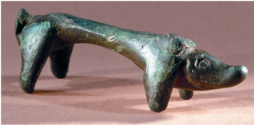
Abb. 20: Keltisches Eberfigürchen aus Erwitte (Kr. Soest). Bronzeguss, Fragment. Unmittelbar vor Redaktionsschluss wurde nachträglich der Oberteil der Plastik entdeckt. Ihr als Rahmenwerk gestalteter Borstenkamm weist auf eine Herkunft aus dem Ostalpenraum hin. Wie und warum diese Tierdarstellung nach Westfalen kam, ist noch völlig offen.

wissenschaftlichen Leitung von H. Polenz können aber nun den ästhetischen Geschmack eines Menschen aus der Zeit um 500 v. Chr. vor Augen führen (Polenz 2004). Für ihn hatte man drei Materialien und damit drei Grundfarben zusammen geführt. Die Ohringe, der Armring und die Halsringe bestanden aus Bronze. Belebt wurde dieser Goldglanz durch rote Bernsteinperlen (im Originalfund völlig vergangen) und durch das Brust-Gehänge, das mit dem Silberglanz vom Eisen und dem Goldglanz der Bronzeplatten spielte (Abb. 19).