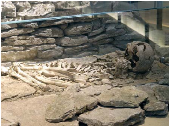
Abb. 2: Höxter-Albaxen (Kr. Höxter). Männerbestattung in seitlicher Hockerstellung; charakteristisch für die Frühbronzezeit.