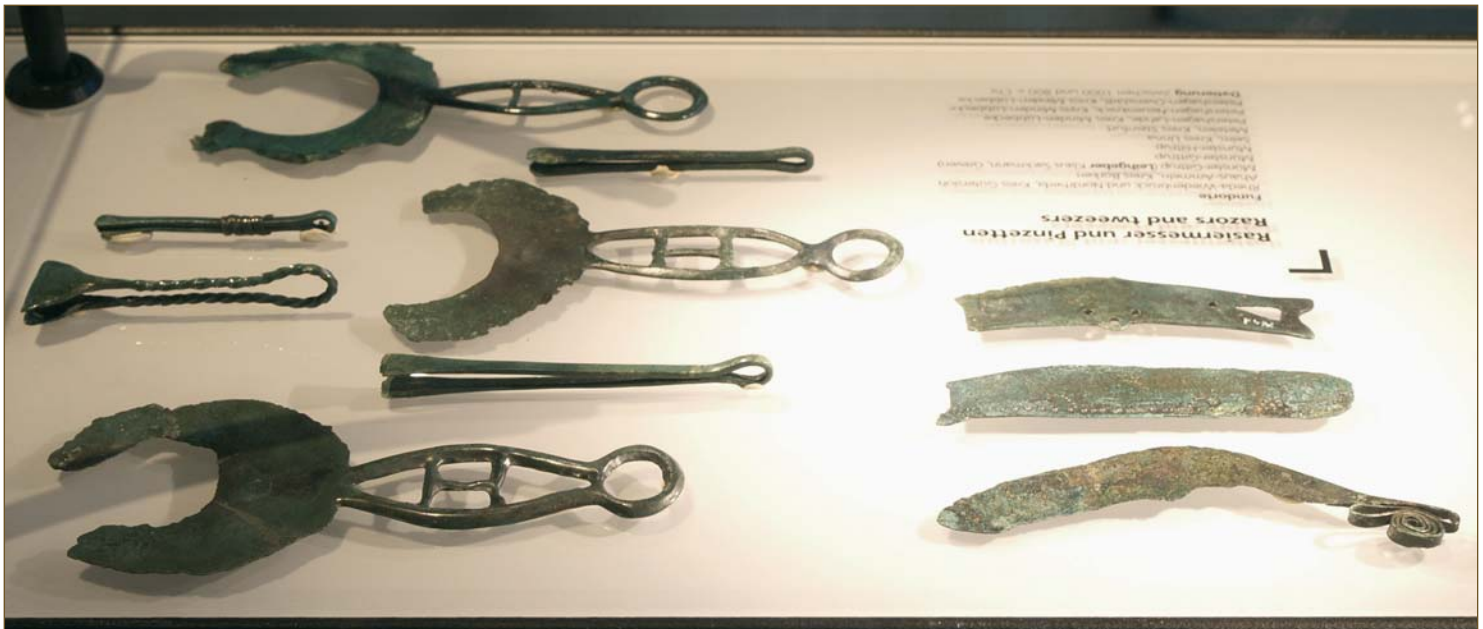
Abb. 7: Bronzene Rasiermesserklingen und Pinzetten aus Männerbestattungen der Jungbronzezeit (Landesmuseum Herne).

Die Verbrennung der Leiche eines Erwachsenen ergibt etwa 1600 bis 2000 g kalzinierte Knochen (den Leichenbrand), die chemisch verändert sind und sich im Boden nicht mehr auflösen. Der Leichenbrand wurde von den Hinterbliebenen aus der Asche des Scheiterhaufens sorgfältig aufgesammelt und gewaschen. Anschließend wurde er in einem Tongefäß (der Urne) deponiert oder mit einem Tuch umwickelt und bestattet. Wir haben es, je nach dem ob eine Urne verwendet wird oder nicht, mit einem Urnengrab oder einem Leichenbrandnest zu tun. Selbst in der Urne wurde der Leichenbrand kaum ohne Schutz mit Erde zugeschüttet. Er war vielmehr mit einem Tuch, einem Brett, einer Steinplatte oder einer Tonschüssel abgedeckt. Dennoch findet man heute zunächst in der Urne die Erde, die nachträglich eingedrungen ist. Darunter kommt der Leichenbrand und auf ihm – oder darin eingebettet – ein Beigefäß für eine Trankbeigabe (manchmal sogar zwei) und evtl. die eine oder andere Beigabe aus – im Normalfall – nicht organischem Material.