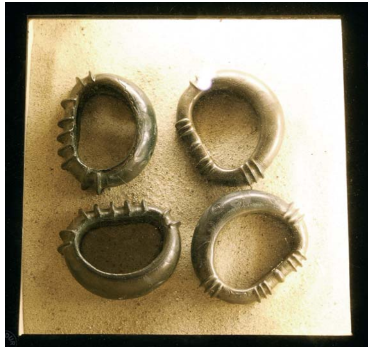
Abb. 10: Osthessisch-westthüringische Hohlwulst-Armringe der Jungbronzezeit, die 1869/70 in Münster-Handorf beim Bau der Eisenbahn gefunden wurden (Ausstellungssituation im Landesmuseum Herne).

Neben den fremden Schwertern sind auch einheimische Messer wie die von Löhne-Mennighüffen (Kr. Herford) und Petershagen-Hävern (Kr. Minden-Lübbecke) zu nennen. Die recht eigenwillige Form mit „doppelt-T-förmigem“, einen Holzgriff imitierenden Bronzehohlgriff ist mitteleuropäisch bisher nur zwölfmal belegt. Diese Messer sind aufwändig genug gestaltet, um eine besondere, wahrscheinlich kultische Bedeutung für sich beanspruchen zu können. Die Verbreitung ihrer Fundstellen vom Niederrhein