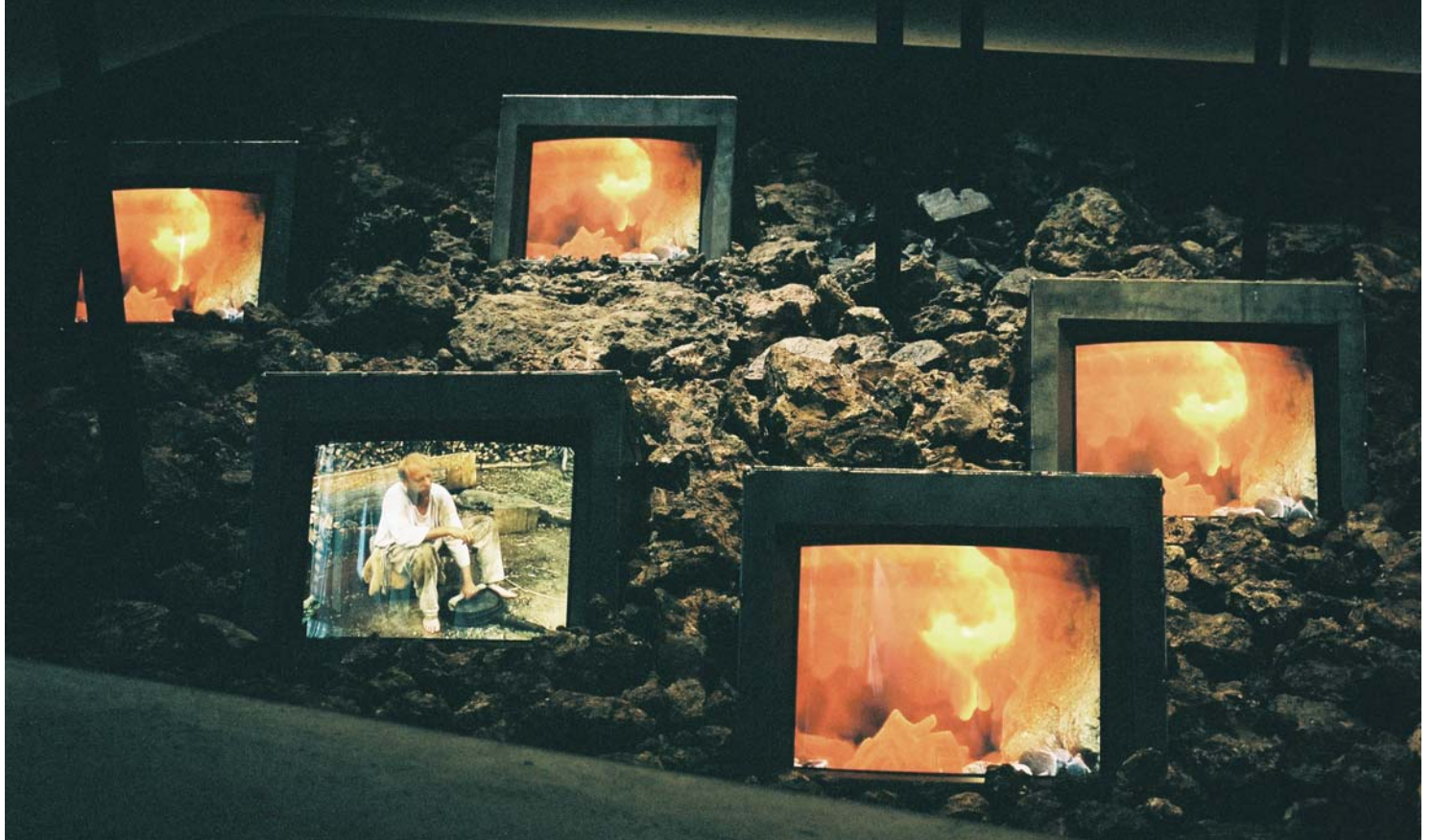
Abb. 11: Eisenverhüttung in der Eisenzeit. Video- und Material-Installation im Landesmuseum Herne.

Kupfer- und Zinnmangel hin oder her – Westfalen besorgte sich irgendwie die Rohstoffe, um das herzustellen, was gerade benötigt wurde. Wogegen diese Rohstoffen getauscht wurden, ist für die Bronzezeit allerdings meist noch nicht klar. In Dortmund scheint immerhin eine Handelsstation fassbar zu sein, an der Getreide und Eicheln für Handelszwecke aufgearbeitet wurden (BRINK-KLOKE/MEURERS-BALKE 2003).