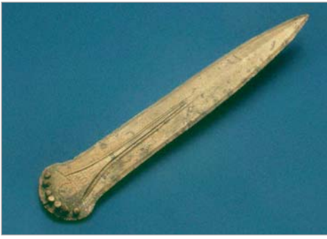
Abb. 9: Verzierte Schwertklinge aus Bronze, Opfergabe an die Gottheit der Weser (?). Mittelbronzezeit.

Wiehengebirge (Porta Westfalica-Hausberge, Kr. Minden-Lübbecke) flankierten oder unvermittelt in der Landschaft auftraten (Olfen, Kr. Coesfeld; Paderborn). Die Horte von Halle und Borgholzhausen umfassen Beile und Lanzenspitzen, die beschädigt sind oder gar nur als Bruchstücke vorliegen. Es handelt sich offensichtlich um Verstecke von Altmetall, das eingeschmolzen werden sollte. Die verzierten Armringe, die durch ein Tongefäß geschützt in Olfen gefunden wurden, mögen das „Familiensilber“ oder das Vorratslager eines Händlers darstellen. Die Beile von Paderborn und das Ensemble von der Porta Westfalica (zwei verzierte Beile und ein Dolch, alles unversehrt) sind aber Gegenstände, die einer Gottheit des Sumpfes oder des Flusses geopfert wurden.