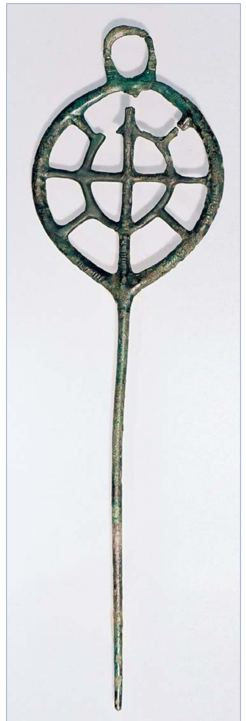
Abb. 6: Gewandschließe (sog. Doppelradnadel) einer mittelbronzezeitlichen Frau aus Werther (Kr. Gütersloh).