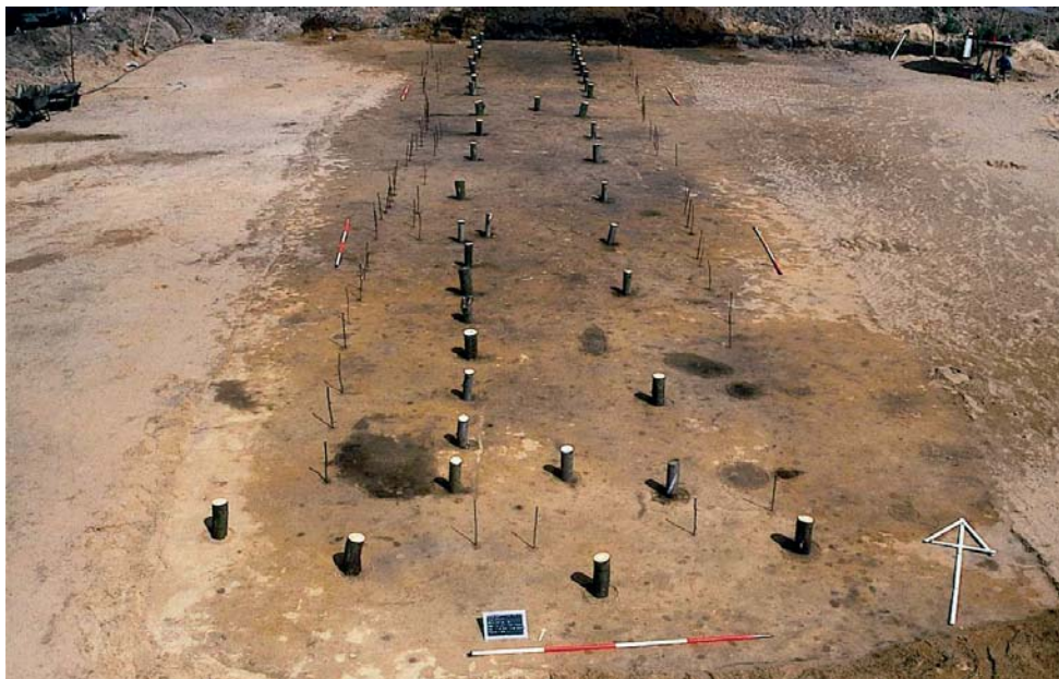
Abb. 4: Standfläche eines frühbronzezeitlichen Hauses in Rhede (Kr. Borken). Bei der Markierung der Pfostengruben für das Foto haben die Ausgräber Dachträger (dicke Hölzer) und Wandverankerungshölzer (dünne Stäbe) unterschieden.