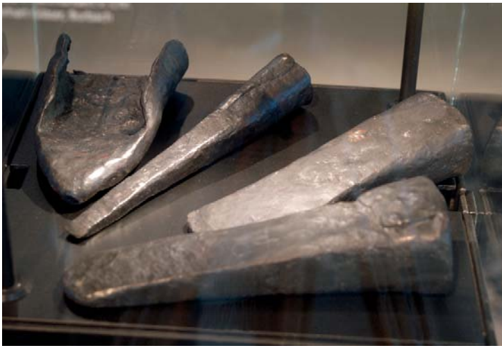
Abb. 12: Produkte der eisenzeitlichen Siegerlandindustrie: Pflugschar, Tüllenmeißel und –beile aus Burbach (Kr. Siegen-Wittgenstein).

Die Siegerländer Industrie produzierte aber nicht nur Eisenbarren sondern auch Fertigprodukte wie die Tüllenbeile und -meißel und die Pflugschar aus Burbach (Kr. Siegen-Wittgenstein) (Abb. 12). Der Markt, den sie belieferte, lag aber nicht vorrangig in Westfalen, sondern am Rhein und in der Wetterau, in keltischen Gebieten. Als kurz vor Christi Geburt die keltische Zivilisation zusammenbrach und die keltische Nachfrage ausfiel, brach auch die Siegerländer Industrie zusammen und verschwand (LAUMANN 1993).