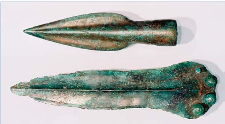
Abb. 5: Bewaffnung eines Mannes aus der beginnenden Mittelbronzezeit (Grabfunde aus Petershagen-Döhren [Kr. Minden-Lübbecke] im Landesmuseum Herne).

Aus den späteren Abschnitten der Bronzezeit kennen wir paradoxerweise weniger Hinweise auf Siedlungen als aus der Frühbronzezeit. Einige Hausgrundrisse von Greven-Schmedehausen (Kr. Steinfurt) und Rhede (Kr. Borken), Telgte-Raestrup (Kr. Warendorf) und Rheine-Altenrheine (Kr. Steinfurt) dürften aber dorthin gehören. Das Haus von Altenrheine war insgesamt dreischiffig. Sein Dach wurde von zwei Reihen kräftiger Pfosten getragen, die Außenwand hingegen von auffällig dünnen Staken.