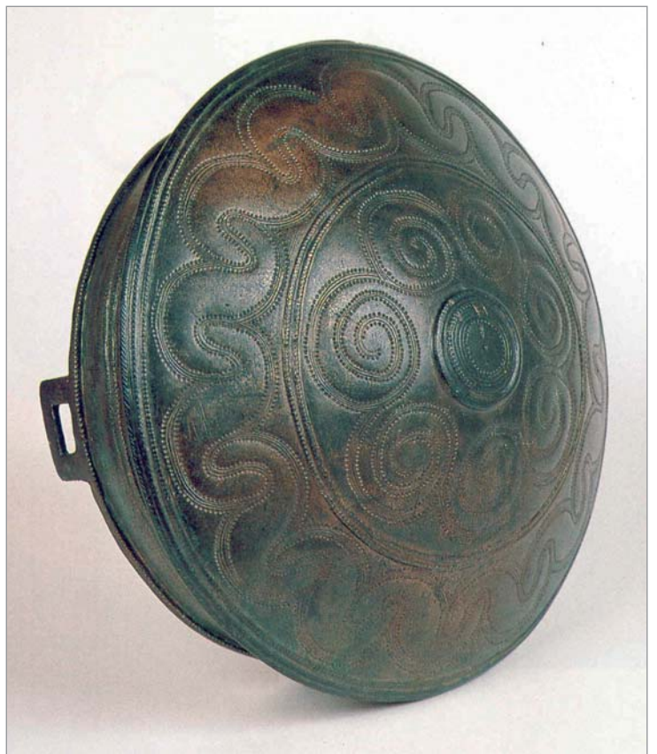
Abb. 8: Reich verziertes Bronzebecken aus einem jungbronzezeitlichen Kindergrab in Rheda-Wiedenbrück (Kr. Gütersloh). Das ursprünglich aus Sachsen-Anhalt importierte Gefäß befindet sich heute in der Schau-sammlung des Historischen Museums der Stadt Bielefeld.

Aus der Mittelbronzezeit sind fünf Mehrstück-Depots bekannt, die Durchgänge durch den Teutoburger Wald (Halle und Borgholzhausen, Kr. Gütersloh) oder das