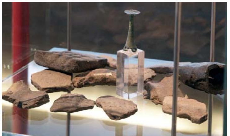
Abb. 15: Lübbecke-Blasheim (Kr. Minden-Lübbecke). Funde aus der eisenzeitlichen Wallburg Babilonie: Gußform (oben links), Eisentüllenbeil (oben rechts), bronzene „Babilonie-Fibel“ (Mitte, auf Plexiglas-Sockel) und Tonscherben (Vordergrund). Installation im Landesmuseum Herne.