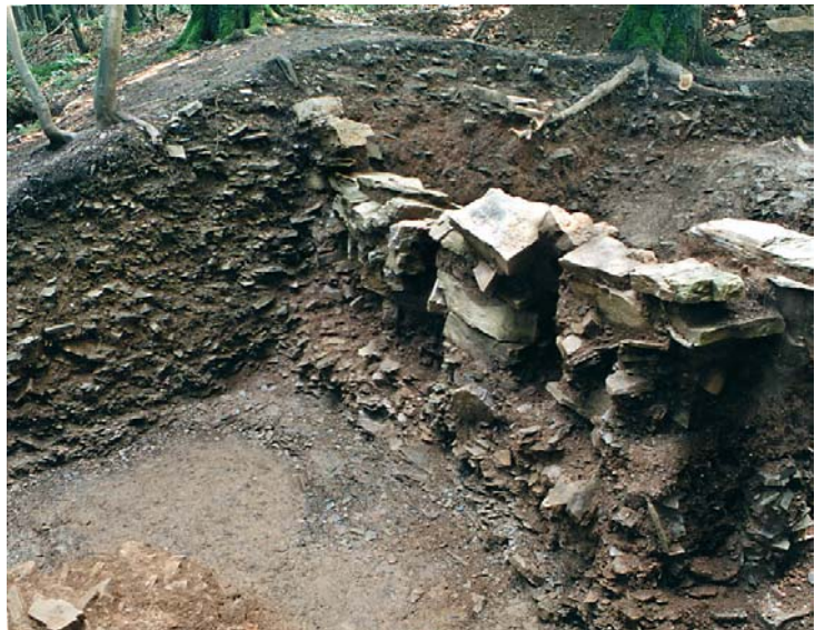
Abb. 14: Sog. Pfostenschlitzmauer der eisenzeitlichen Befestigung auf dem Wilzenberg (Schmallenberg, Hochsauerlandkreis). Die senkrechten Hölzer, die der Trockenmauer Halt geben sollten, sind inzwischen vergangen und hinterließen steinlose Schlitze. Daher nennen Archäologen solche Befunde „Pfostenschlitzmauer“.

Auch die Funde aus der eisenzeitlichen Wallburg Babilonie (Stadt Lübbecke, Kr. Minden-Lübbecke) deuten auf längere Aufenthalte hin (Abb. 15). Dort hat man nicht nur ein Eisenbeil liegen gelassen und Tongefäße zerbrochen, sondern man wollte auch offensichtlich Buntmetall gießen. Dafür spricht die dort gefundene Gußform für Rädchenapplikationen und aufwändige Nadeln. Zum Fundspektrum der eisenzeitlichen Befestigung gehört auch eine eigenwillige Bronzefrosche, die nach der Burg