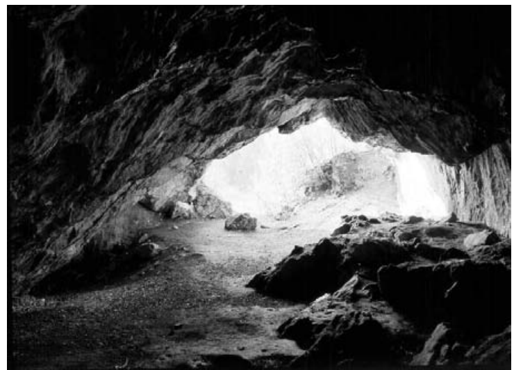
Abb. 17: In den westfälischen Höhlen (besonders im Sauerland) hat man in der Eisenzeit Kulthandlungen vorgenommen und dabei auch Menschen (vor allem Frauen?) geopfert. Vgl. dazu: POLENZ 1991.

Auch die Funde aus der eisenzeitlichen Wallburg Babilonie (Stadt Lübbecke, Kr. Minden-Lübbecke) deuten auf längere Aufenthalte hin (Abb. 15). Dort hat man nicht nur ein Eisenbeil liegen gelassen und Tongefäße zerbrochen, sondern man wollte auch offensichtlich Buntmetall gießen. Dafür spricht die dort gefundene Gußform für Rädchenapplikationen und aufwändige Nadeln. Zum Fundspektrum der eisenzeitlichen Befestigung gehört auch eine eigenwillige Bronzefibele, die nach der Burg „Babilonie-Fibele“ genannt wird. Die Verbreitung aller bisher bekannten 16 Babilonie-Fibelen auf der Babilonie, in Löhne und Hiddenhausen (Kr. Herford), in Ostbevern (Kr. Warendorf) und auf der Schnippenburg bei Ostercappeln (Ldkr. Osnabrück) belegt, dass es sich auch in diesem Fall nur um die Produkte regionaler Werkstätten handeln kann.